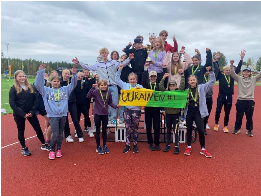
Kuvassa kuntaottelun voittajajoukkue vuosimallia 2024.

Liikunnallisia hetkiä lukuvuodelle 2024-2025!