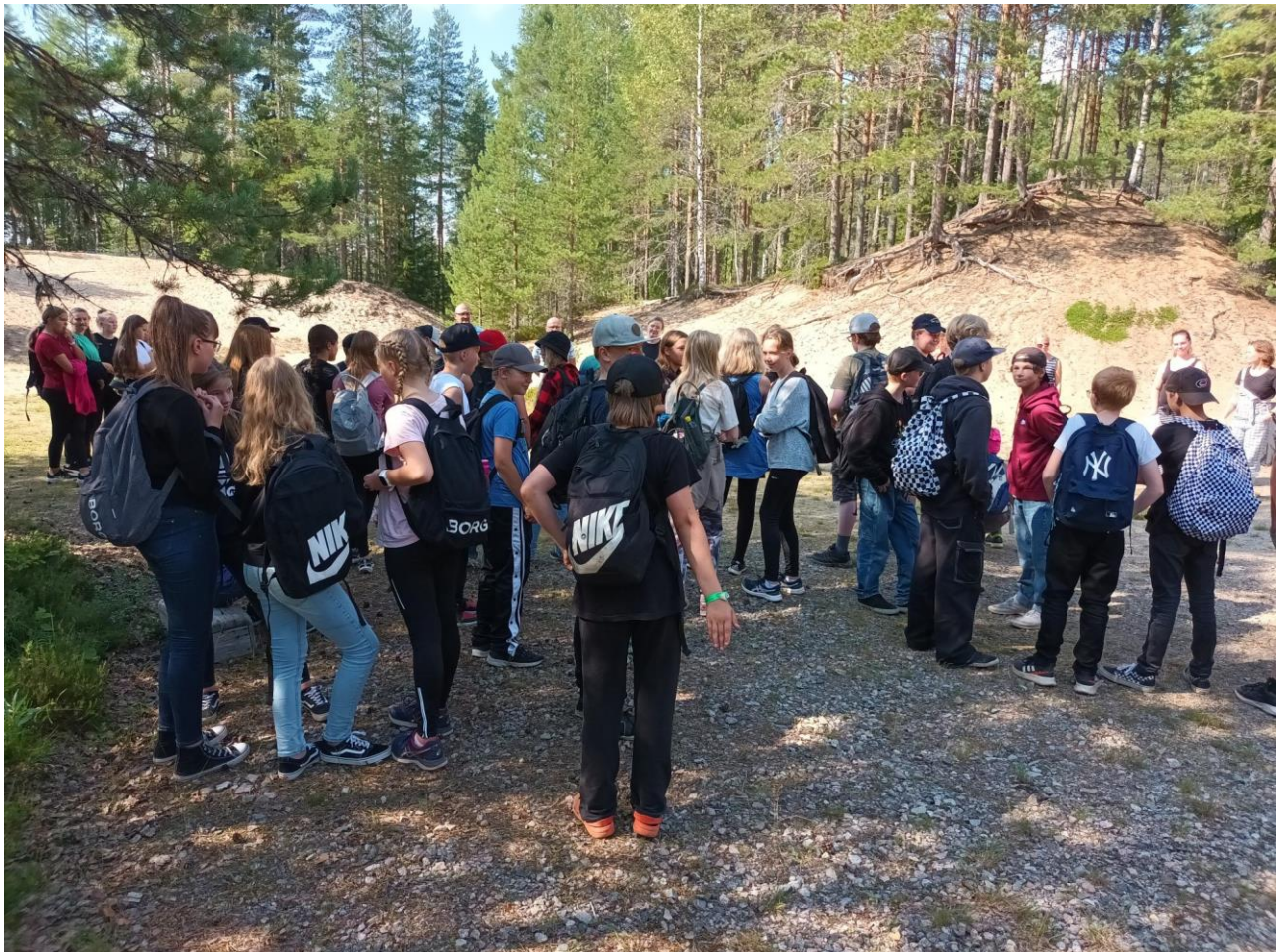
Seiskaluokkalaisten ryhmäytyminen Kokkolammella