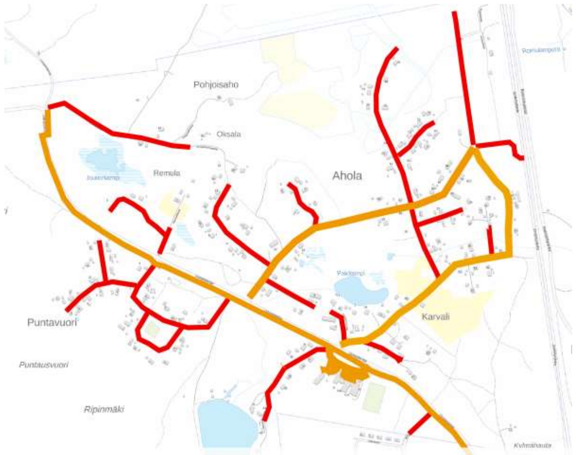
ALUE 2: POHJOISOSA