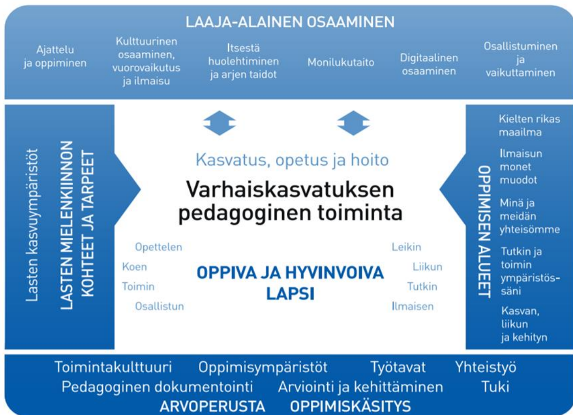
Kuva 1 Varhaiskasvatuksen pedagogisen toiminnan viitekehys

Tavoitteellisen ja inklusiivisen toiminnan perustan luovat arvoperusta, oppimiskäsitys, niihin pohjautuva toimintakulttuuri sekä monipuoliset oppimisympäristöt, yhteistyö, työtavat ja lapsen tuki . Lasten mielenkiinnon kohteet ja tarpeet sekä heidän kasvuympäristöönsä liittyvät merkitykselliset asiat ovat toiminnan suunnittelun lähtökohtana. Lähtökohtana ovat myös oppimisen alueet. Laadukkaana pedagogisen toiminnan edellytyksenä on suunnitelmallinen dokumentointi, arviointi ja kehittäminen. Laaja-alaisen osaamisen tavoitteet ohjaavat osaltaan toiminnan suunnittelua.