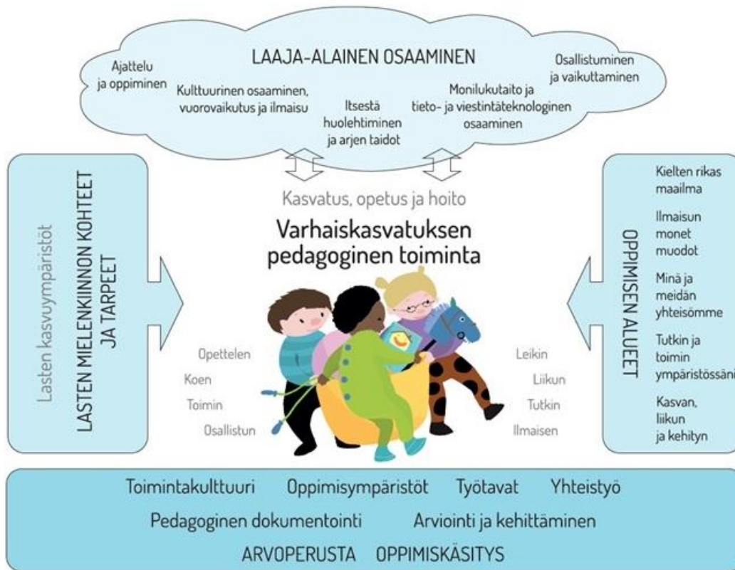
Kuva 1 Pedagogisen toiminnan viitekehys (OPH).